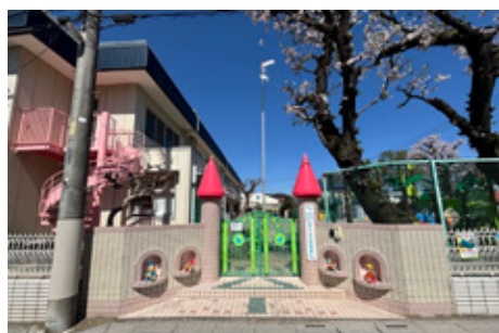
青いとり幼稚園（現地より徒歩 8 分）