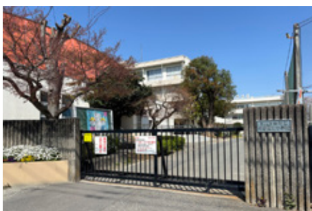
与野西北小学校（現地より徒歩 12 分）