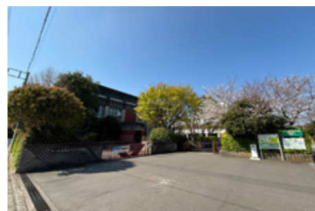
八王子中学校（現地より徒歩 8 分）

※各施設までの徒歩所有時間（距離）は、「最も遠い号棟を起点」に計測しております。徒歩分数は 80m=1 分として計算、端数は切り上げています。