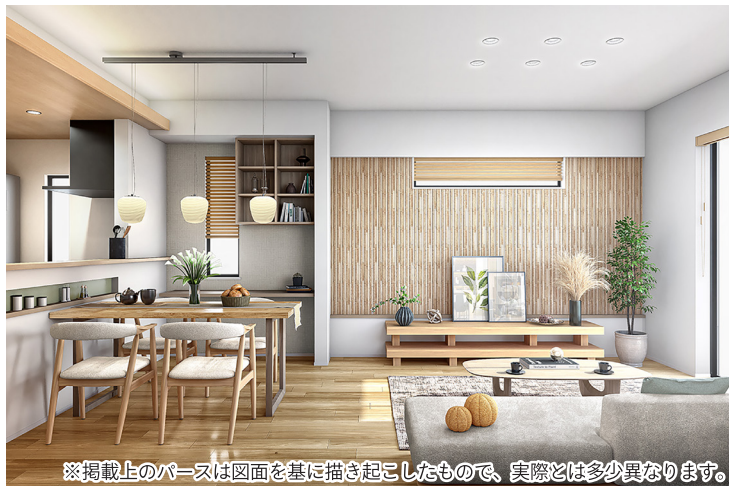
※掲載上のパースは図面を基に描き起こしたもので、実際とは多少異なります。

LDK17帖超の広さに、天井高2.7mの開放的なリビング。 美しい空間と健やかな毎日を彩るこだわりのインテリア。 号棟により、リビング学習に最適なシェアカウンターや仕事や 趣味、書斎として使用できるマルチルームなどを採用しています。