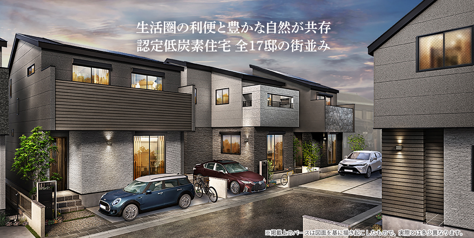
※掲載上のパースは図面を基に描き起こしたもので、実際とは多少異なります。