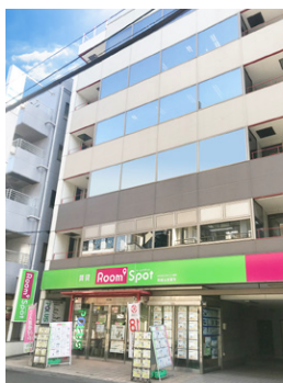
本社・1F南越谷営業所