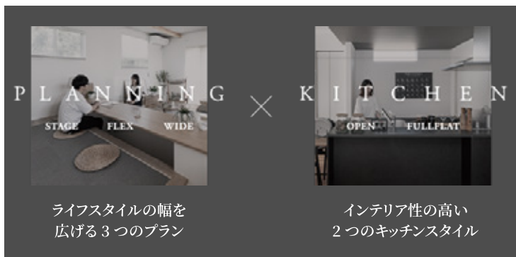
ライフスタイルの幅を 広げる3つのプラン

住まいに求めたのは見た目からくつろぎを感じられながらも、 個性や家族団らの時間を深められる空間であること。 個性あるプランニングとホテルライクな間接照明や木のインテリア材を融合させた、贅沢でラグジュアリーな空間をご提案します。