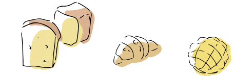
サンメリー越谷店 徒歩 11 分 / 830m 定番の食パンから惣菜パン、季節限定の商品まで幅広く揃います。常に焼きたての香りが漂う、地域に親しまれるベーカリーです。