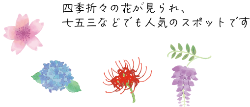
越谷市花田苑 徒歩 6 分 / 420m 水と緑、石と木が織りなす日本の庭の美。季節の移ろいとともに、心を整える静かな時間が流れる庭園です。