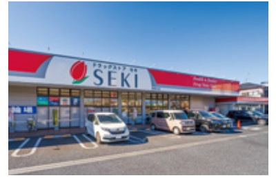
ドラッグストアセキ東越谷店 徒歩 8 分 / 620m