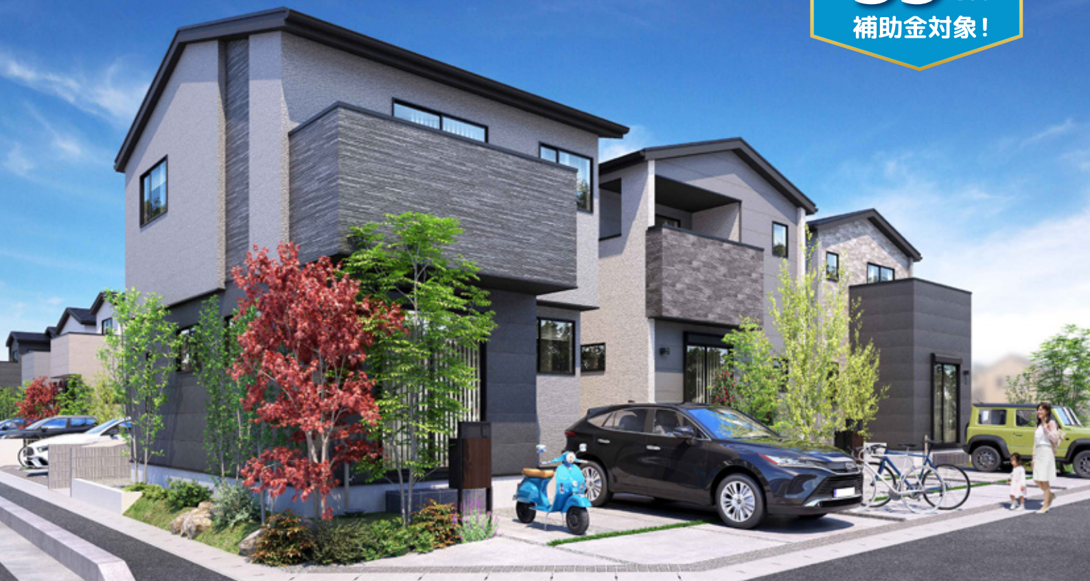
※掲載上のパースは図面を基に描き起こしたもので、実際とは多少異なります。