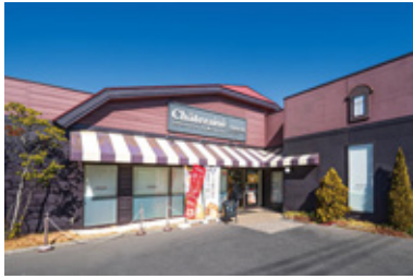
シャトレーゼ東越谷店 徒歩 7 分 / 560m