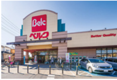
ベルク東越谷店 徒歩 8 分 / 640m