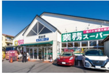
業務スーパー越谷店 徒歩 7 分 / 500m