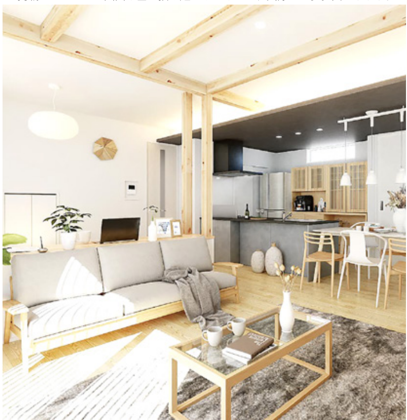
インテリア性の高い 2つのキッチンスタイル