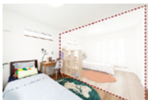
2階4部屋対応プラン