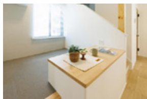
ファミリーラウンジ

1階には家族との繋がりを楽しむプラスαスペース、 2階には自分時間を自由に満喫する個別空間を設けました。